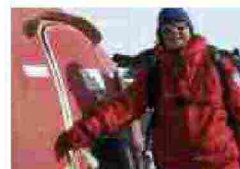
I cambiamenti climatici svelati dai pinguini