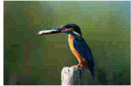
Il Delta del Po: la miniera della biodiversità