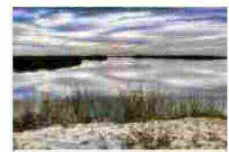
La Giornata mondiale delle zone umide