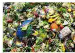
Lo spreco alimentare fa male (anche) all'ambiente