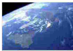
Italia mangiata dal cemento, il rapporto del WWF